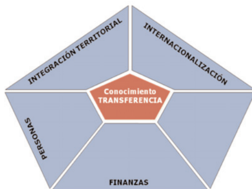
Ilustración 1. Ejes de la Estrategia Estatal de innovación, E2i

En este sentido, el Programa "Extremadura-in" alinea el catálogo de acciones vinculadas al presente vehículo de financiación con los Ejes constitutivos de la Estrategia Estatal de Innovación (E2i), centrándose en el Eje "Finanzas" pero alcanzando, con la totalidad de las acciones que posteriormente se desarrollan, el resto de Ejes. Además, este Programa ha sido elaborado tomando como base los objetivos y los sectores estratégicos de la política regional de I+D+i, desarrollada a través del Plan Regional de I+DT+i.