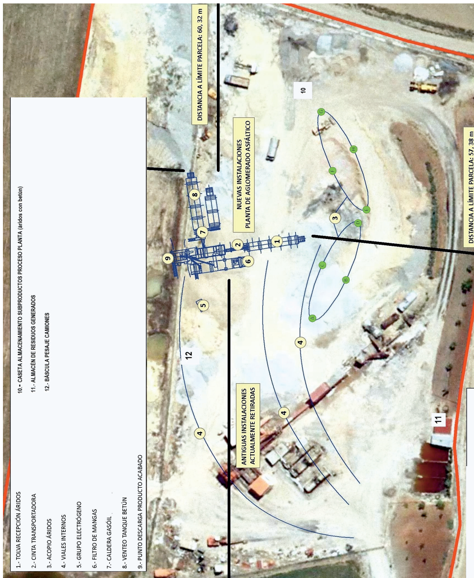
Figura 1. Plano en planta de instalaciones, infraestructuras y equipos.