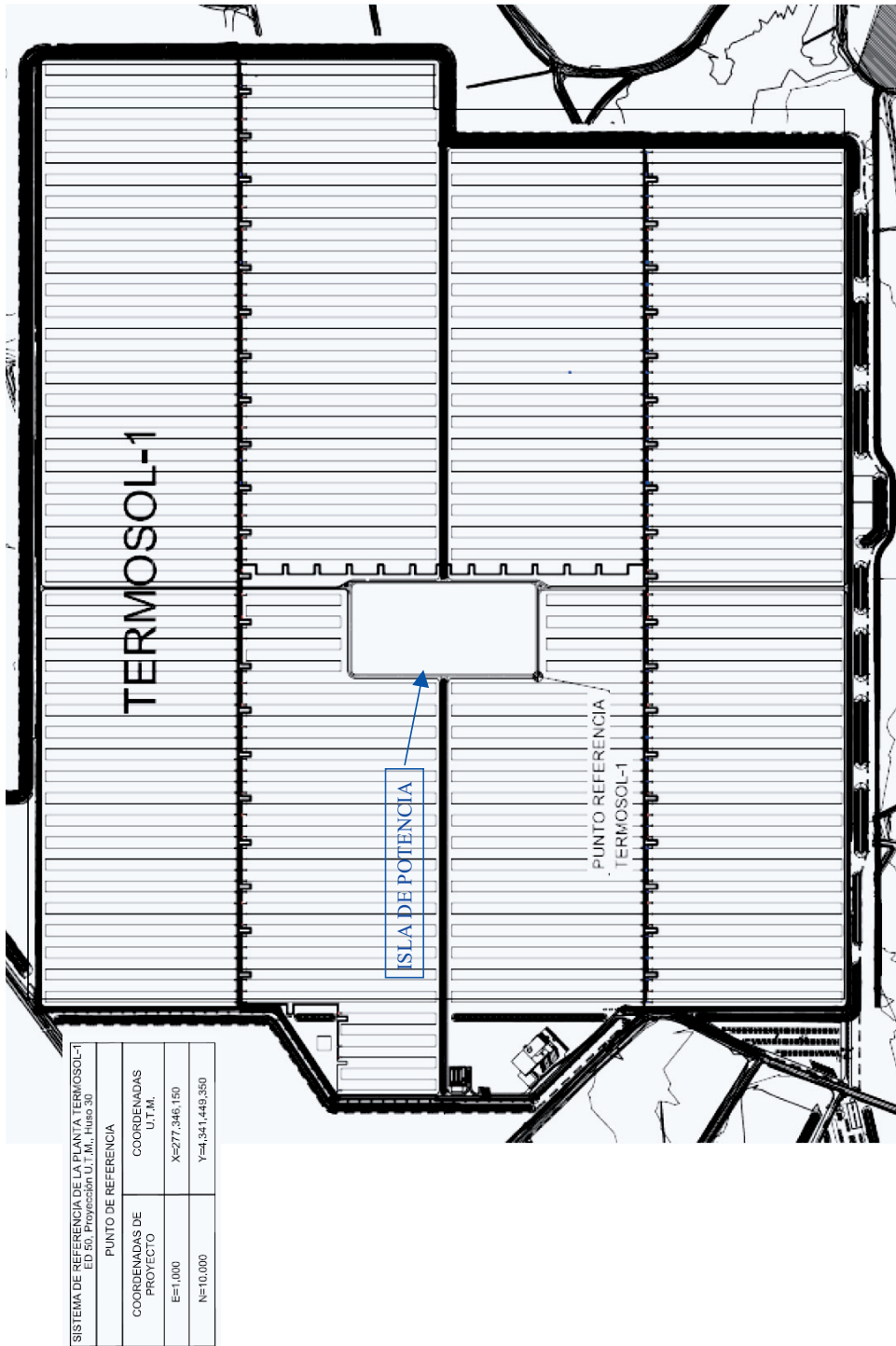
Figura 1. Plano en planta de la termosolar. Campo solar e isla de potencia.