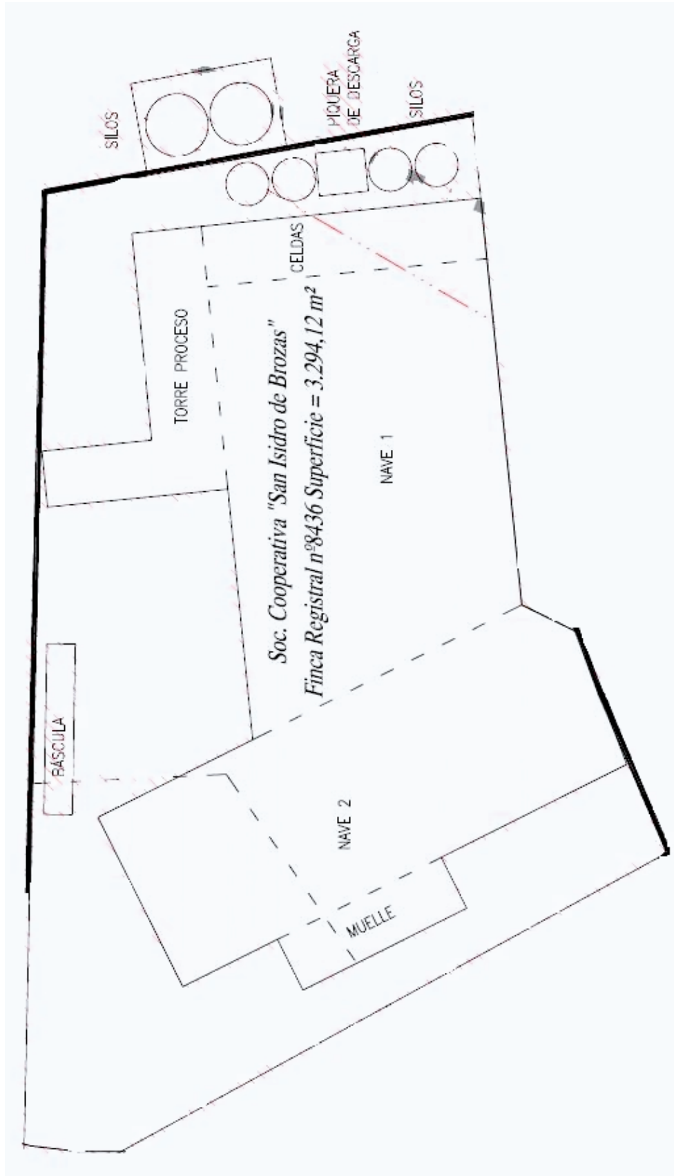
Figura 1. Plano en planta de instalación.