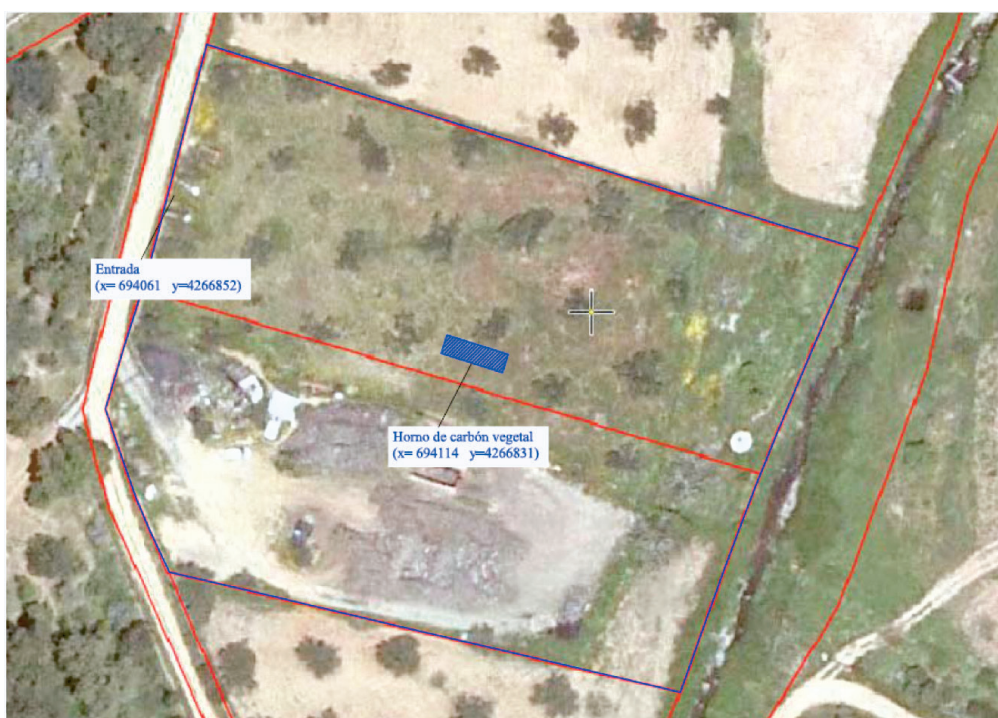
Figura 1 Plano en planta de la instalación.