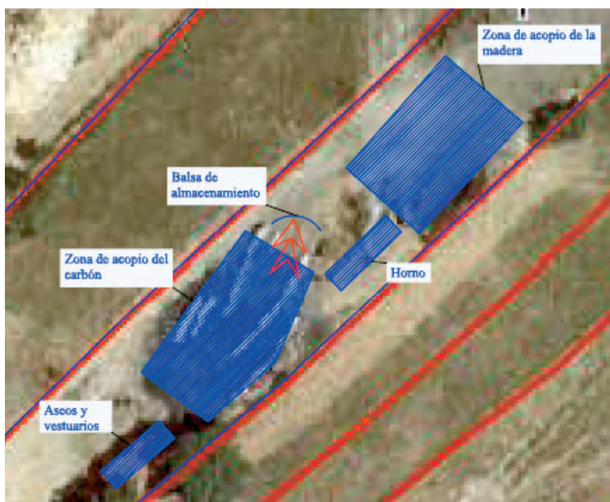
Figura 1 Plano en planta de la instalación.