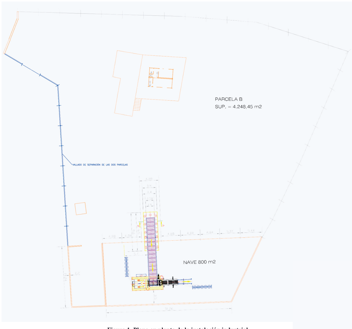
Figura 1. Plano en planta de la instalación industrial.