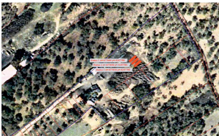
Figura 1. Plano en planta de la instalación