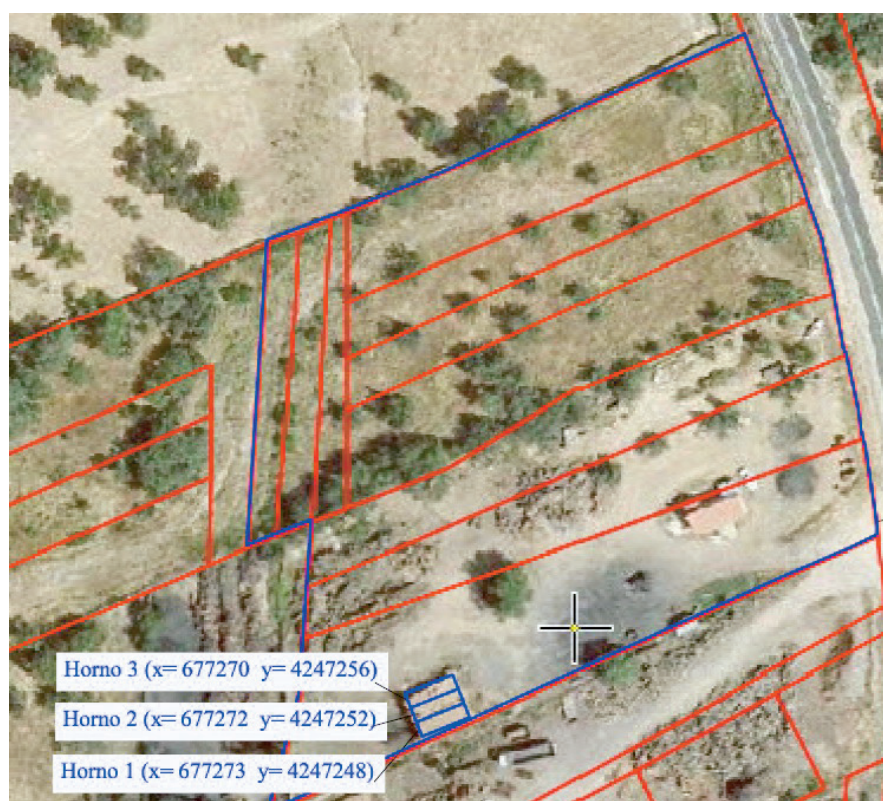
Figura 1 Plano en planta de la instalación.