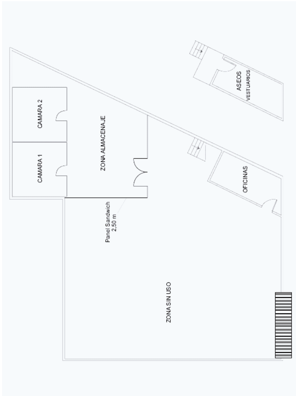
Figura 1. Plano de planta.