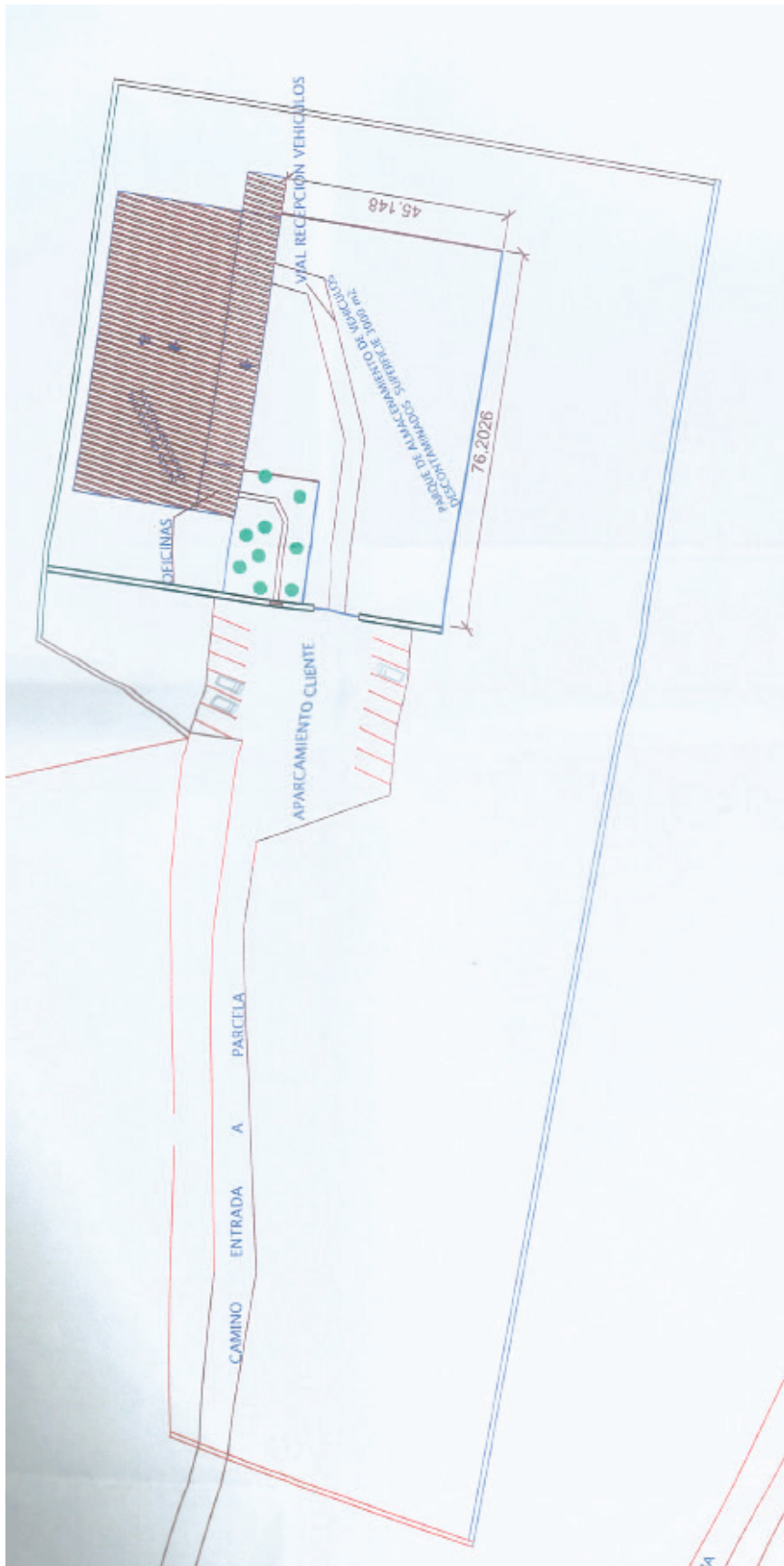
Figura 1. Plano en planta de la instalación industrial.