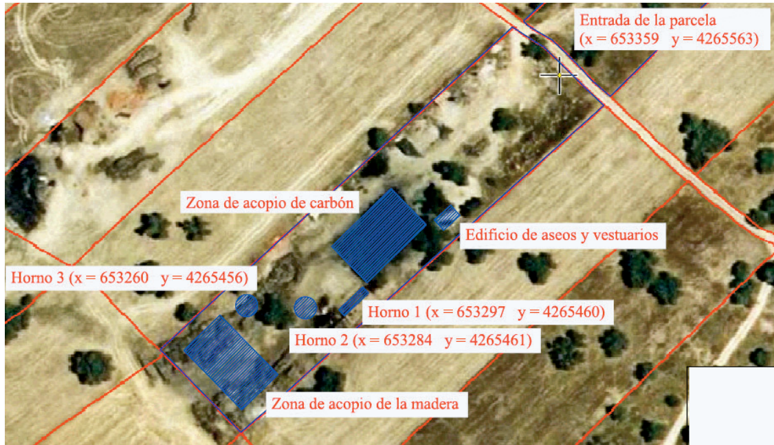
Figura 1 Plano en planta de la instalación.