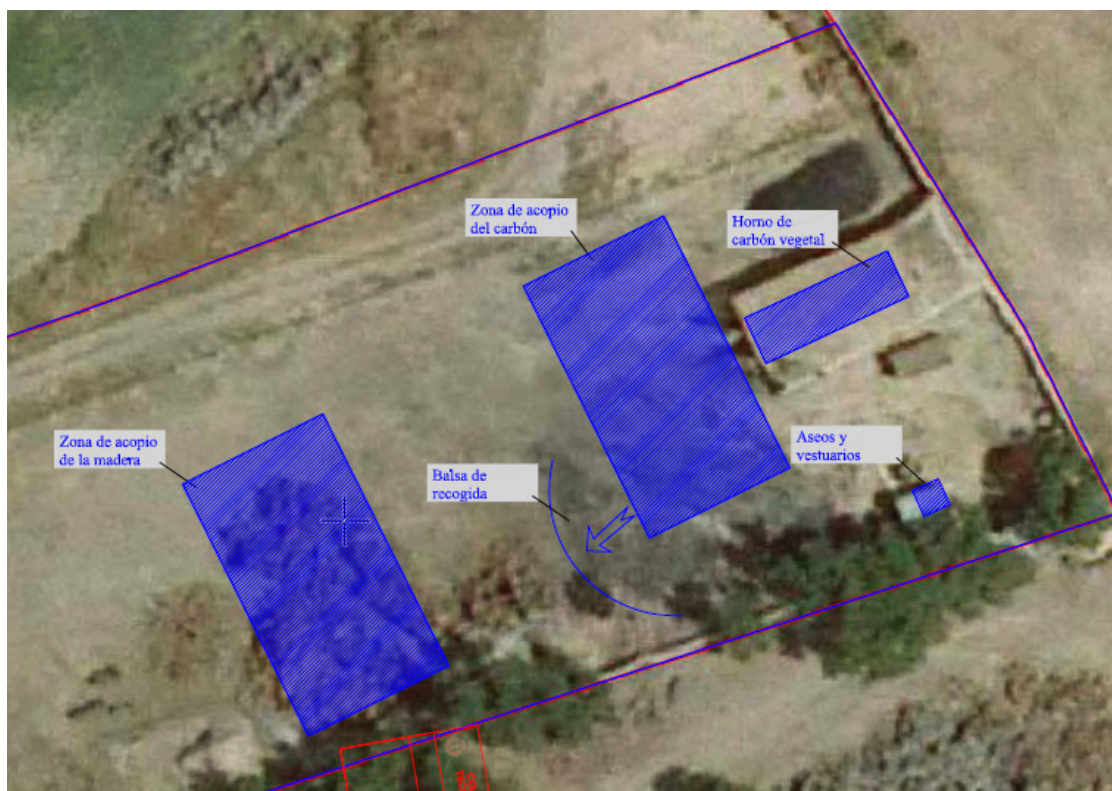
Figura 1 Plano en planta de la instalación.