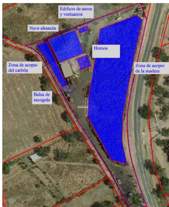
Figura 1 Plano en planta de la instalación.