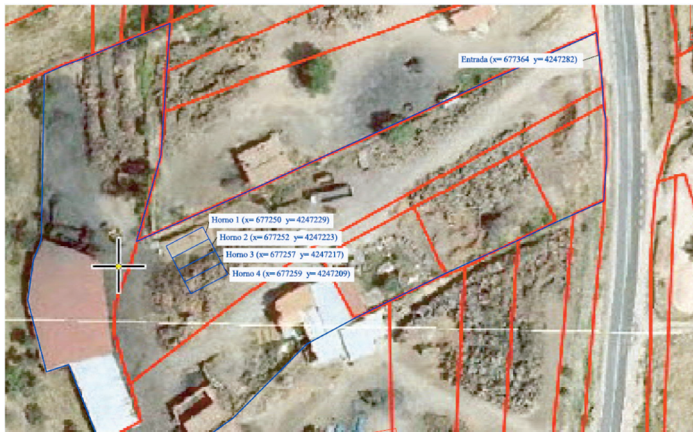
Figura 1 Plano en planta de la instalación.