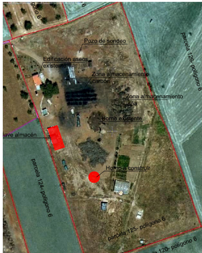
Figura 1 Ortofoto con las instalaciones