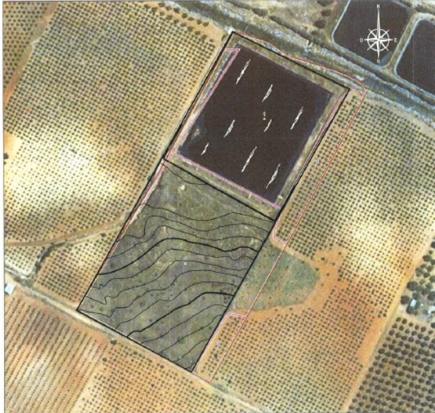
PLANTA GENERAL PARCELA (Ortofoto)