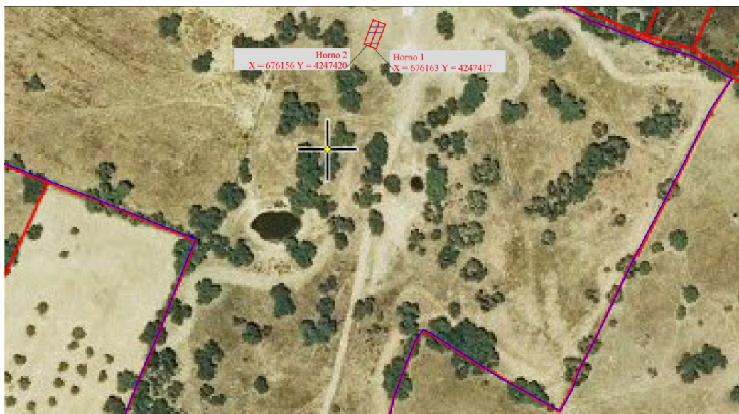
Figura 1 Plano en planta