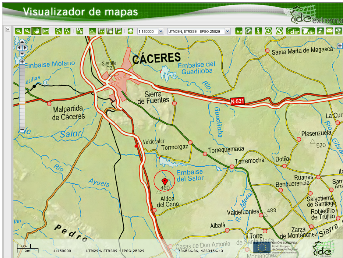
Figura 2. Emplazamiento de la instalación