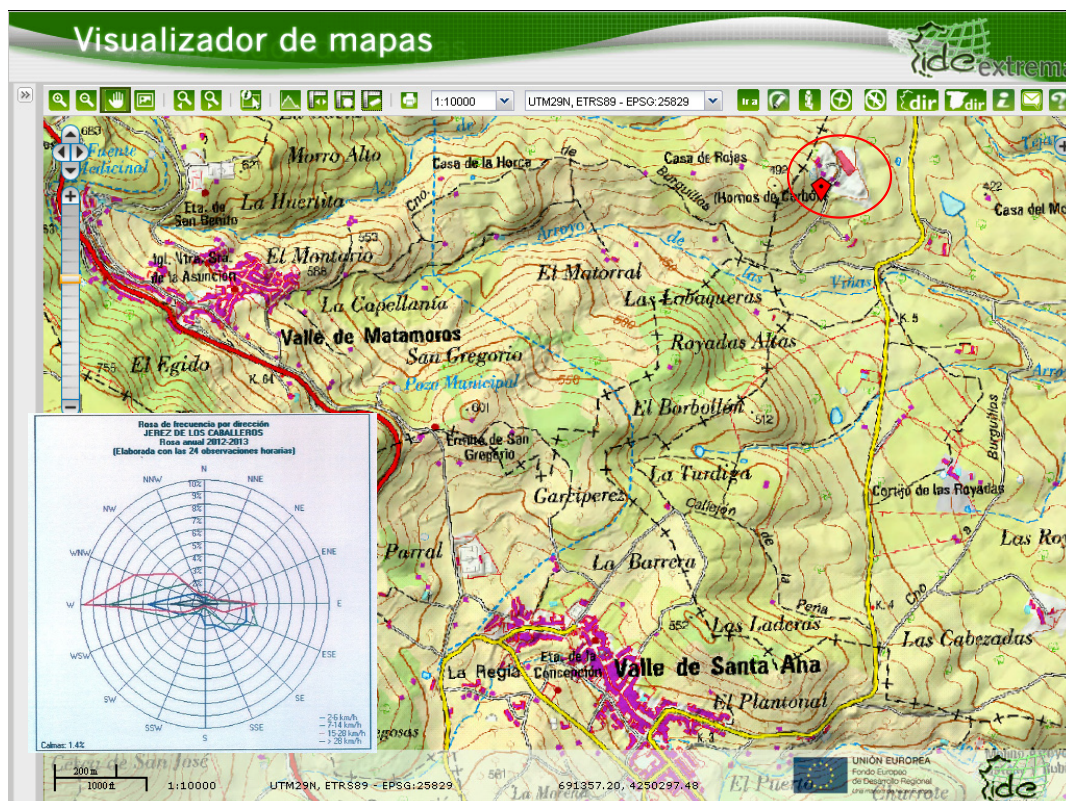
Figura 1. Emplazamiento de la instalación industrial. Se muestra también la rosa de los vientos de la estación de Jerez de los Caballeros