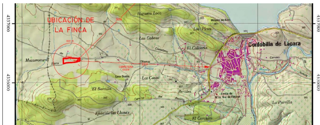
Figura 2. Emplazamiento de la instalación