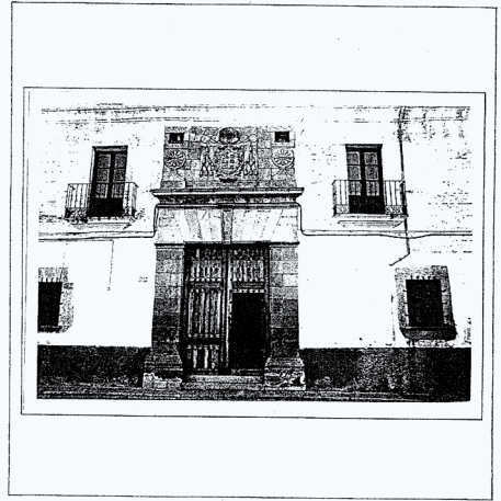
PLAN ESPECIAL DEL CASCO HISTORICO DE CORIA. (CACERES) | DELTA SUR S.A. | SANTIAGO RODRIGUEZ-SIMFENO ARQUITECTO.