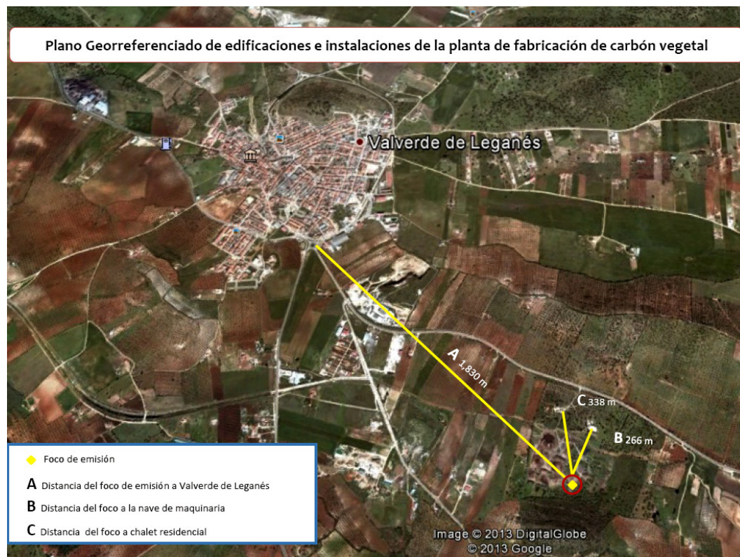
Figura 2. Emplazamiento de la instalación