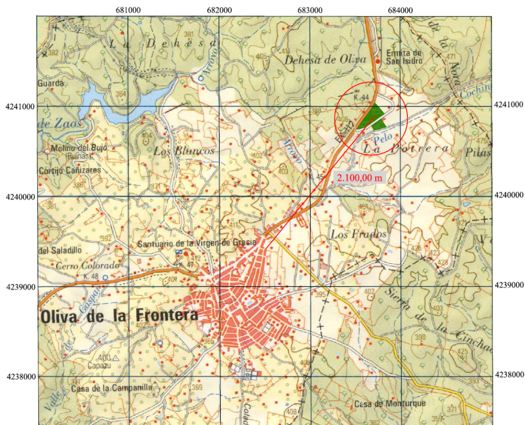
Figura 1. Ubicación de la instalación