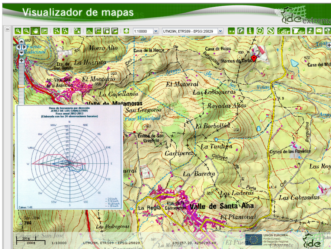
Figura 1. Ubicación de la instalación