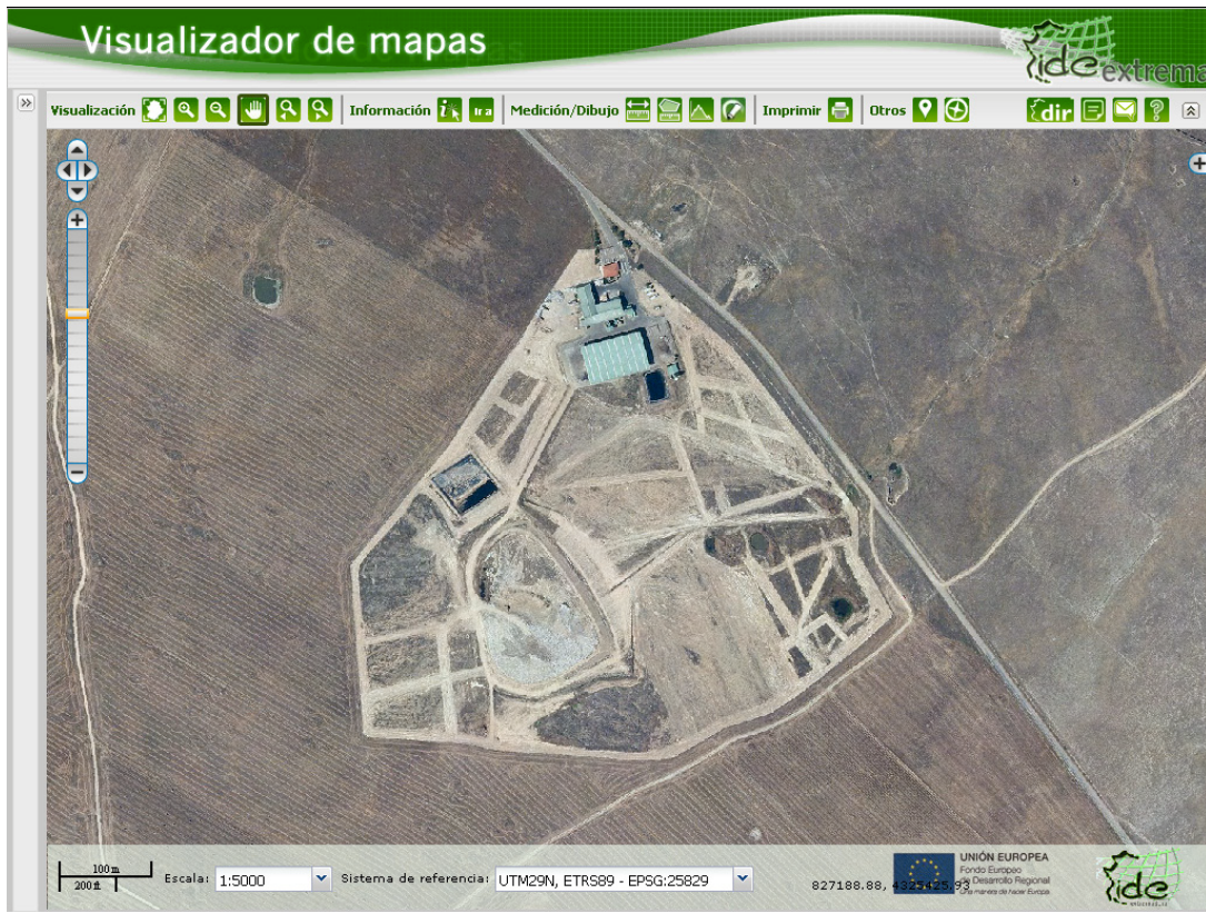
Figura 1. Ortofoto de las instalaciones