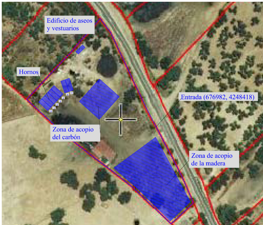
Figura 1 Plano en planta de la instalación.