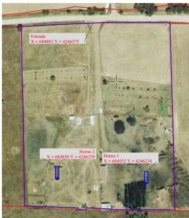
Figura 1 Plano en planta de la instalación.