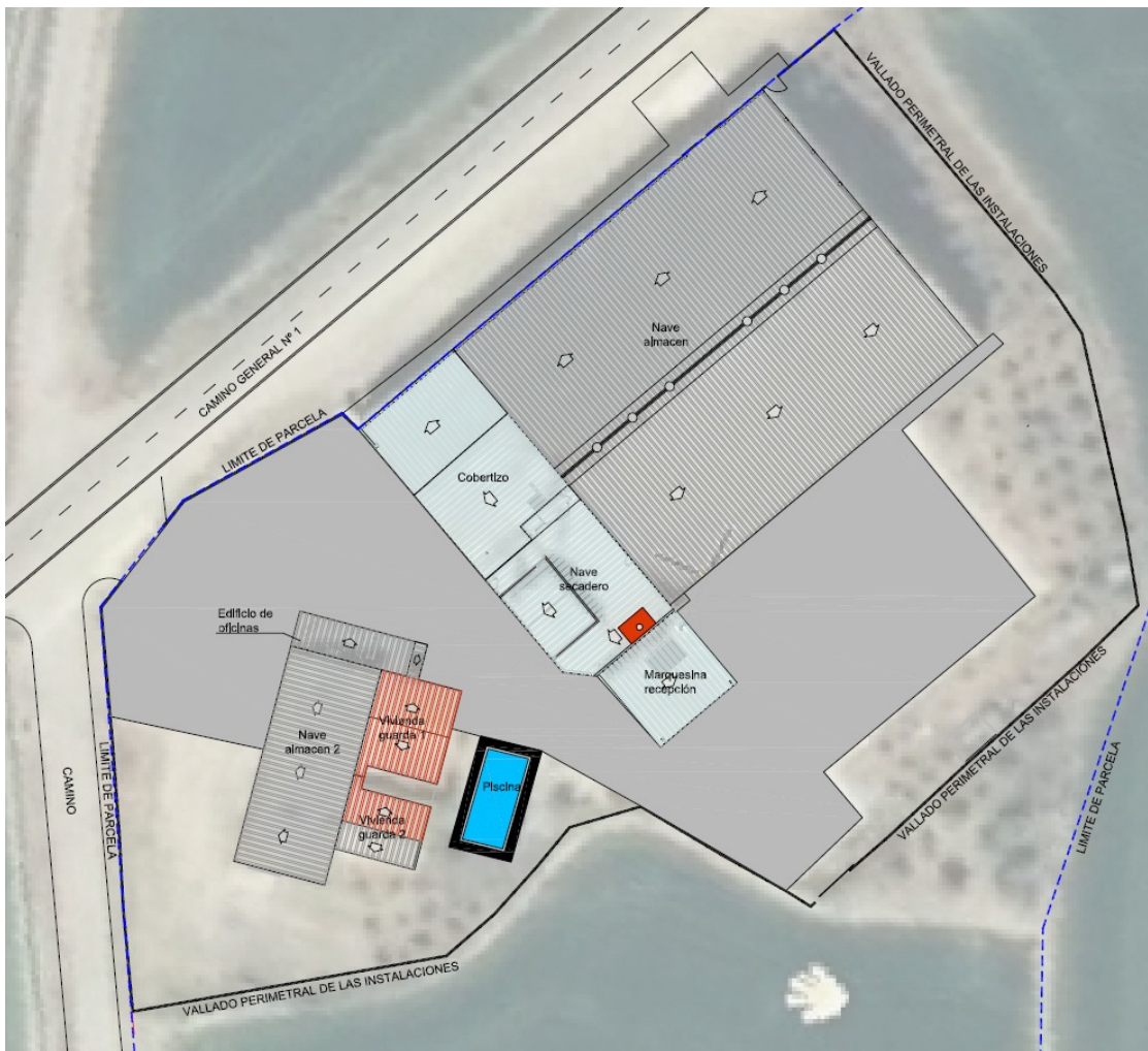
Figura 1. Plano en planta de instalación.