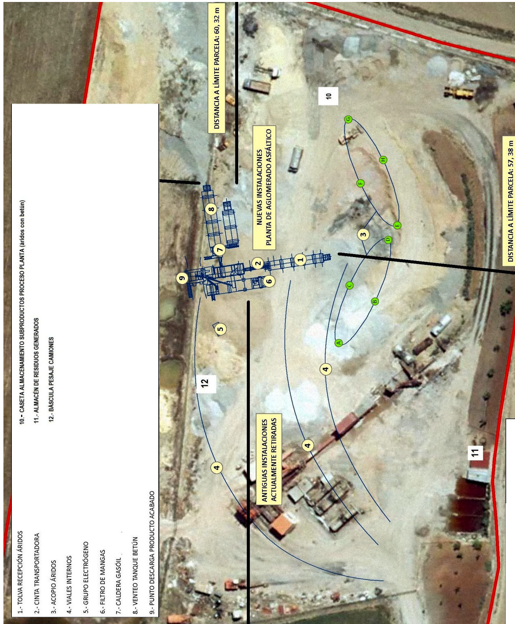
Figura 1. Plano en planta de instalaciones, infraestructuras y equipos de la planta de aglomerado asfáltico