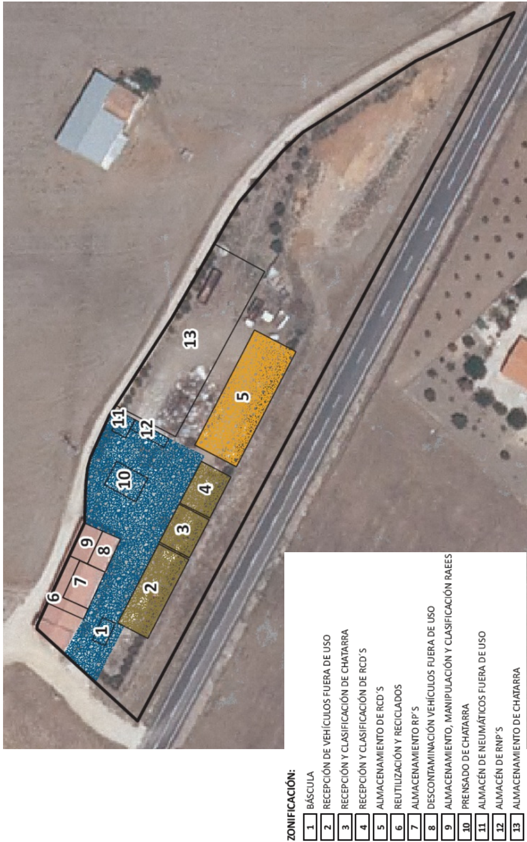
Figura 1. Plano en planta de la instalación industrial. Instalaciones