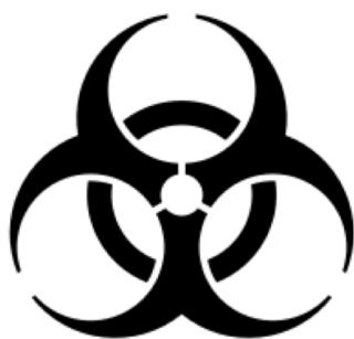
RIESGO DE INFECCIÓN o BIORRIESGO