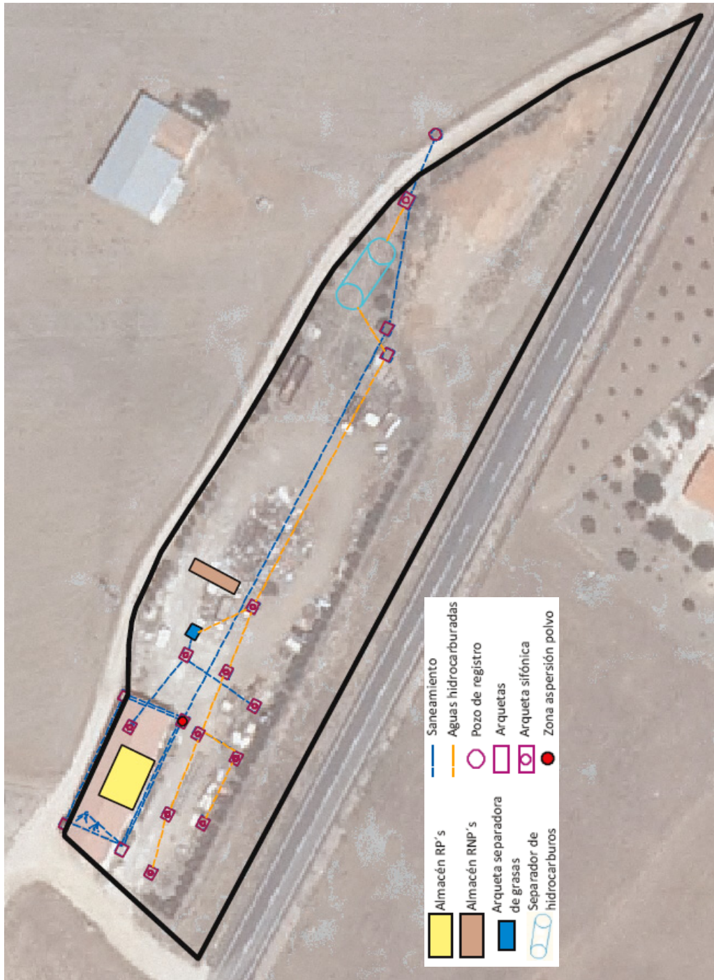
Figura 2. Plano en planta de la instalación industrial. Redes de saneamiento y almacenamiento de residuos generados.