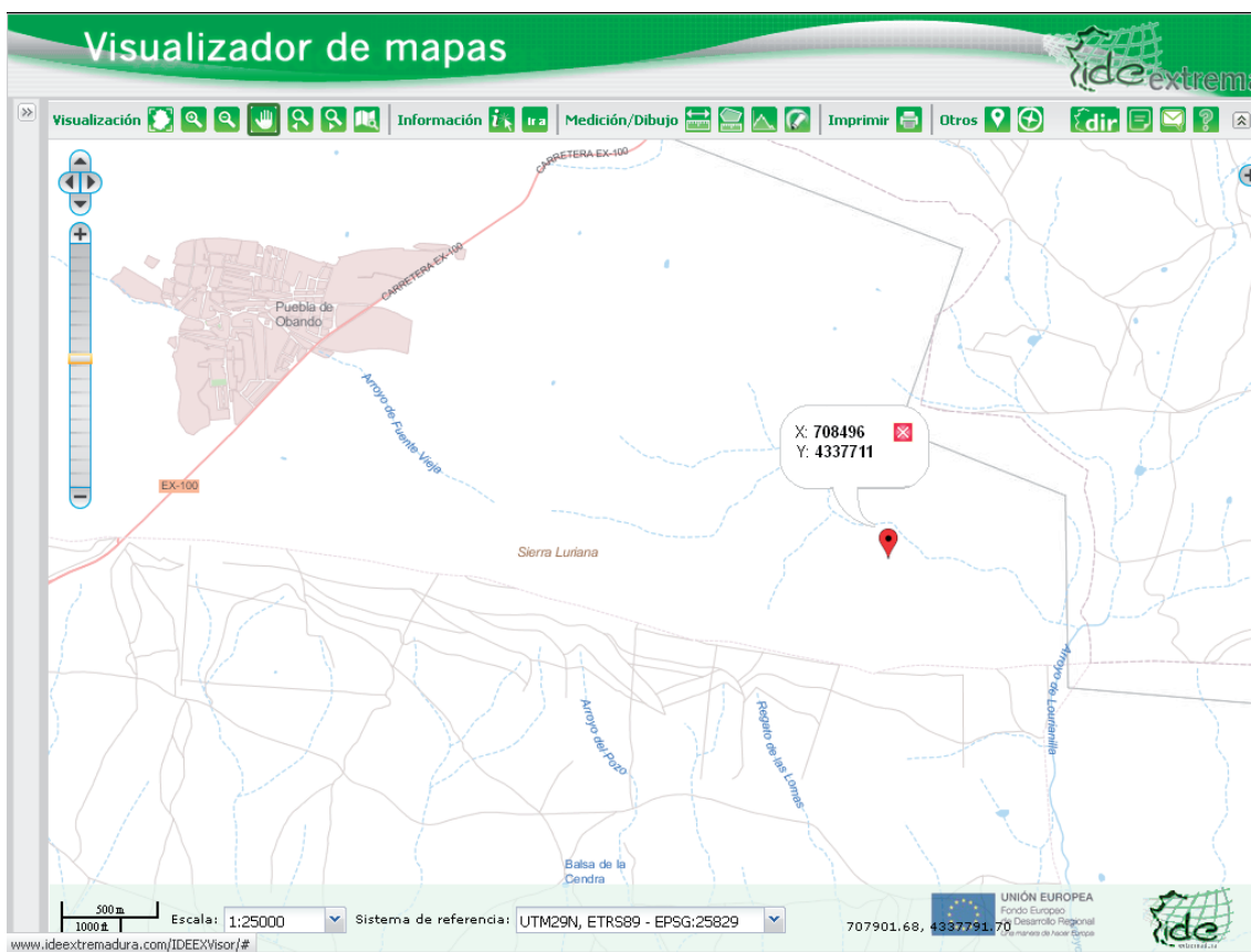
Figura 1. Emplazamiento de la instalación