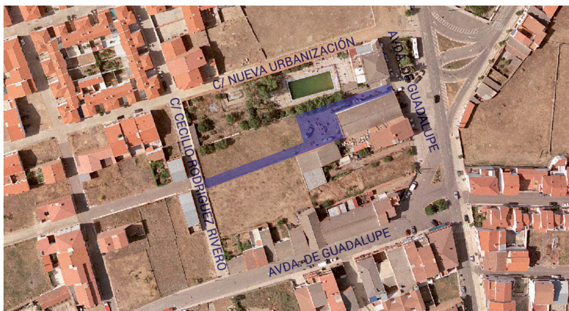
Gráfico 1. Vista aérea de los terrenos afectados

La modificación propuesta afecta a terrenos de propiedad privada identificados catastralmente con la referencia 2864714UJ2126N0001ZS como ya se ha mencionado, y cuyo estado actual es el que se muestra en la fotografía aérea siguiente: