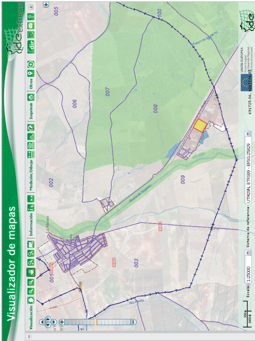
Figura 1. Ubicación de la instalación industrial "El Chaparral", en el término municipal de La Albuera, provincia de Badajoz. El acceso a la instalación se realiza a través de la Ctra. Nacional 432, km. 26. Coordenadas X= 691.684, Y= 4.285.124, ETRS89, huso 29.