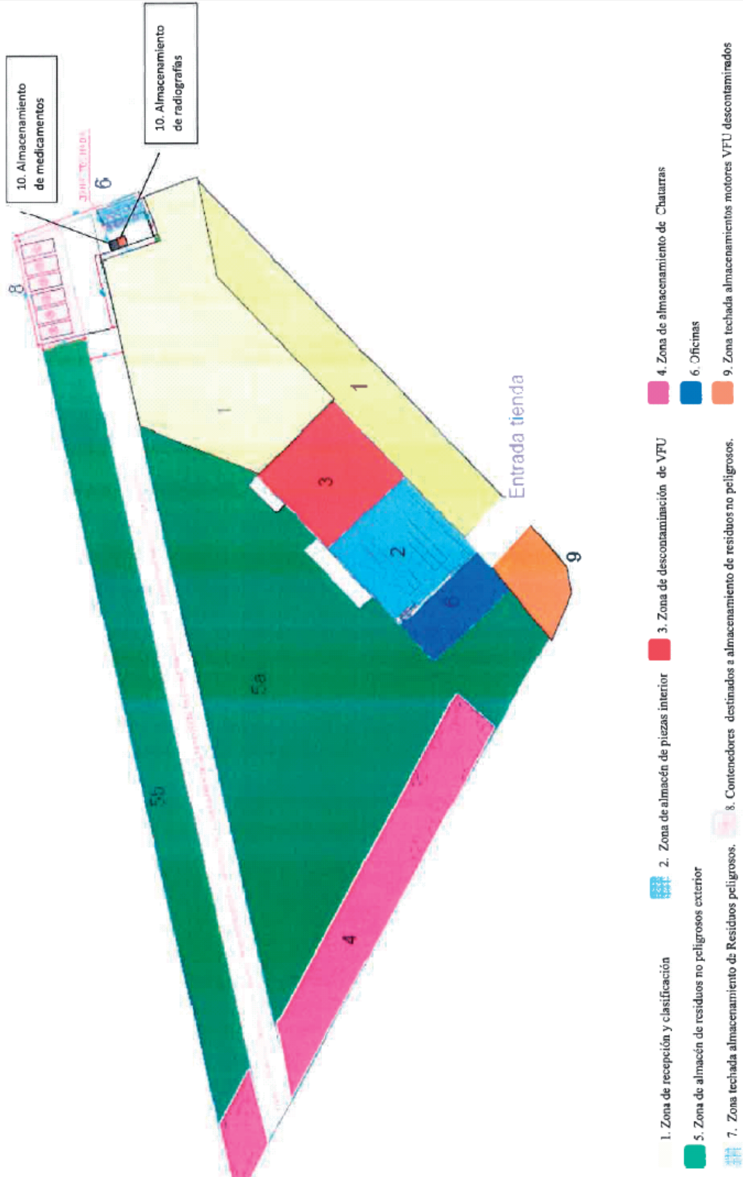
Figura 1. Distribución en planta.