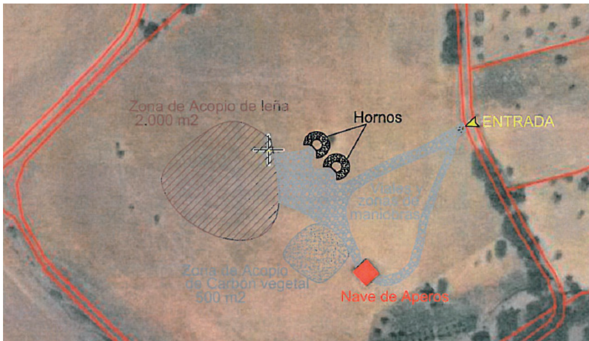
Figura 2. Plano en planta de la instalación