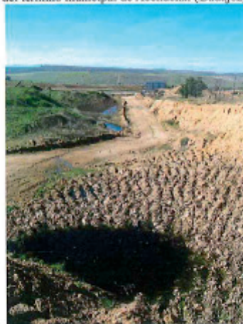
Detalle de la surgencia en la parcela 419 del polígono 17 del término municipal de Acehuchal (Badajoz)