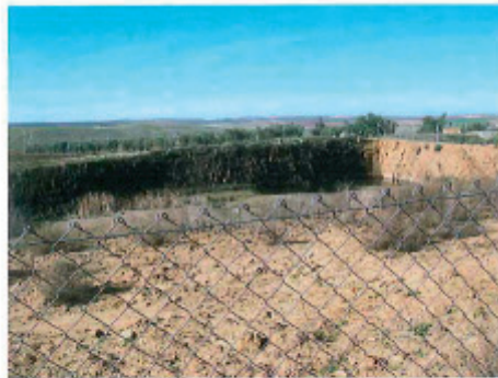
Características de la parcela 105 del polígono 16 del término municipal de Acehuchal (Badajoz).