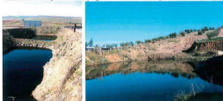
Huecos a diferente cota topográfica rellenos de fluido oscuro y oloroso en la parcela 422 del polígono 17 del término municipal de Acehuchal (Badajoz).