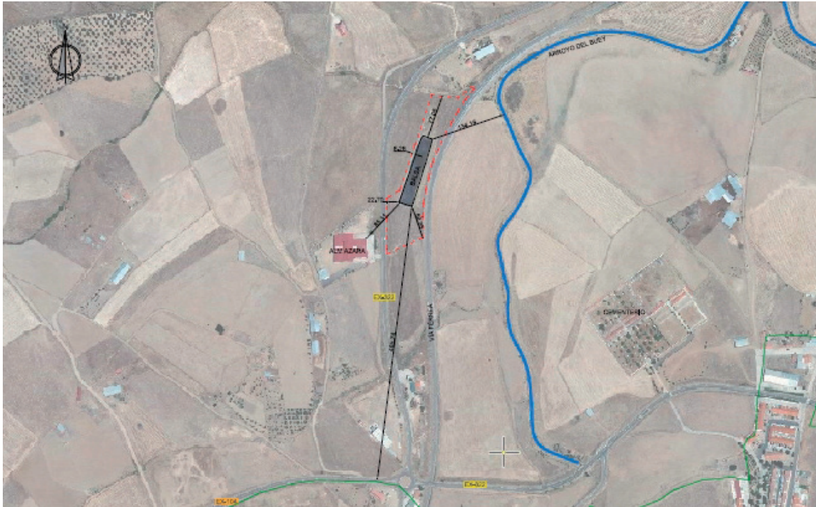
Fig. 1. Vista general de la balsa.