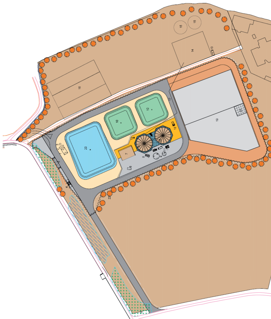
Figura 1. Plano 1 en planta de la instalación. Distribución tras la modificación.