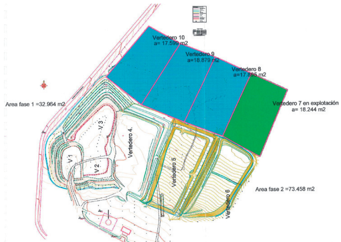
Figura 2. Plano 2 en planta de la instalación. Zona de vasos de vertido.