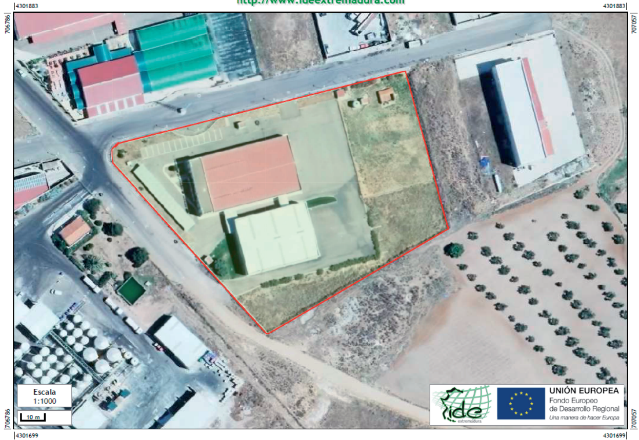
Figura 1. Plano de ubicación de las instalaciones.