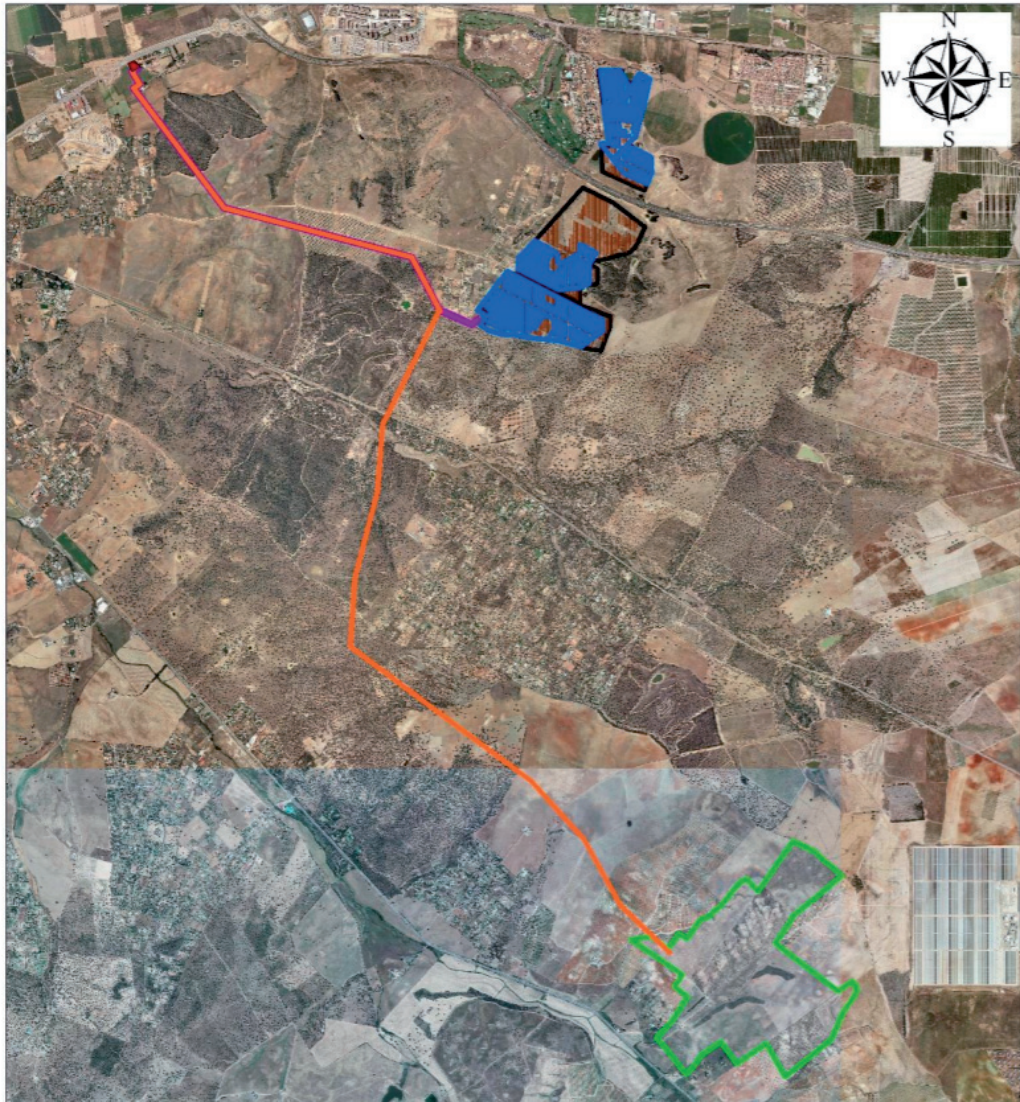
Comparativa de alternativas