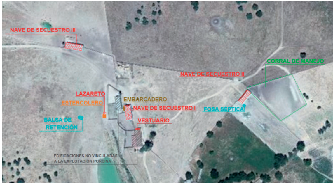
Imagen 1. Planta de las instalaciones