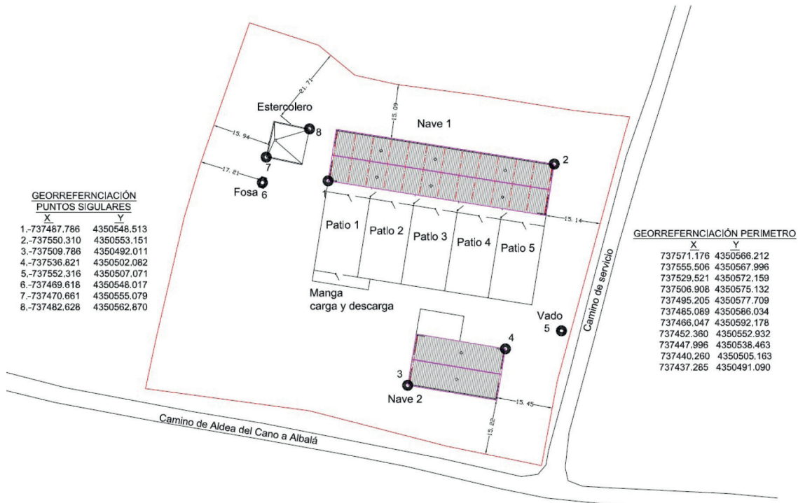
Imagen 1. Planta y coordenadas geográficas de las instalaciones