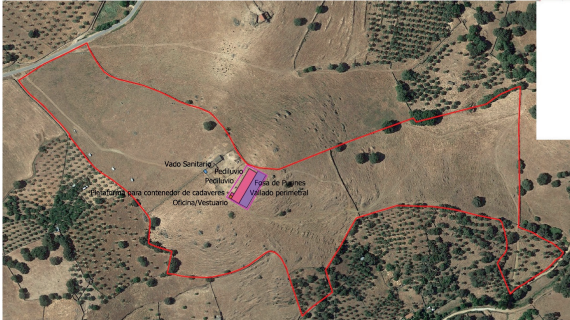
Imagen 1. Planta de las instalaciones