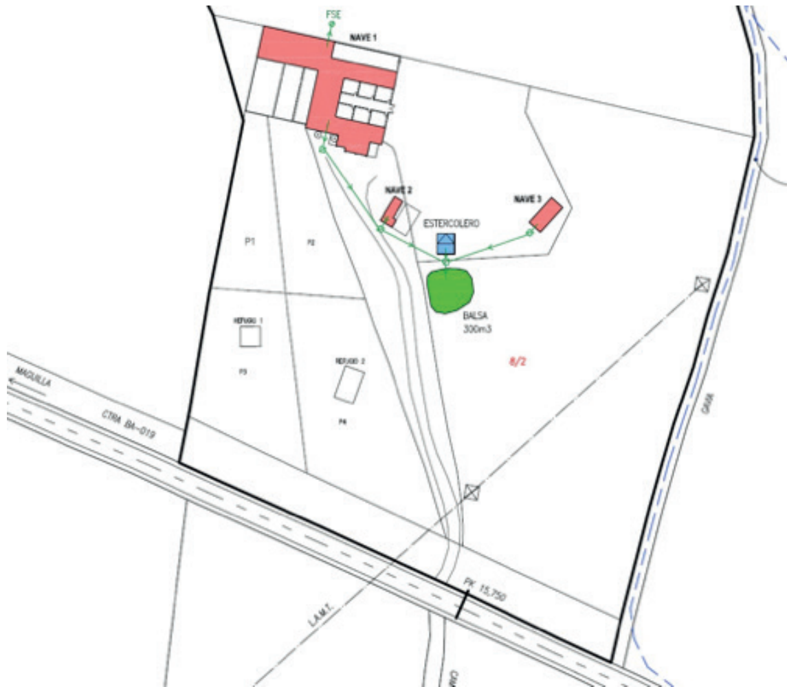
Imagen 1. Planta de las instalaciones y red de saneamiento.