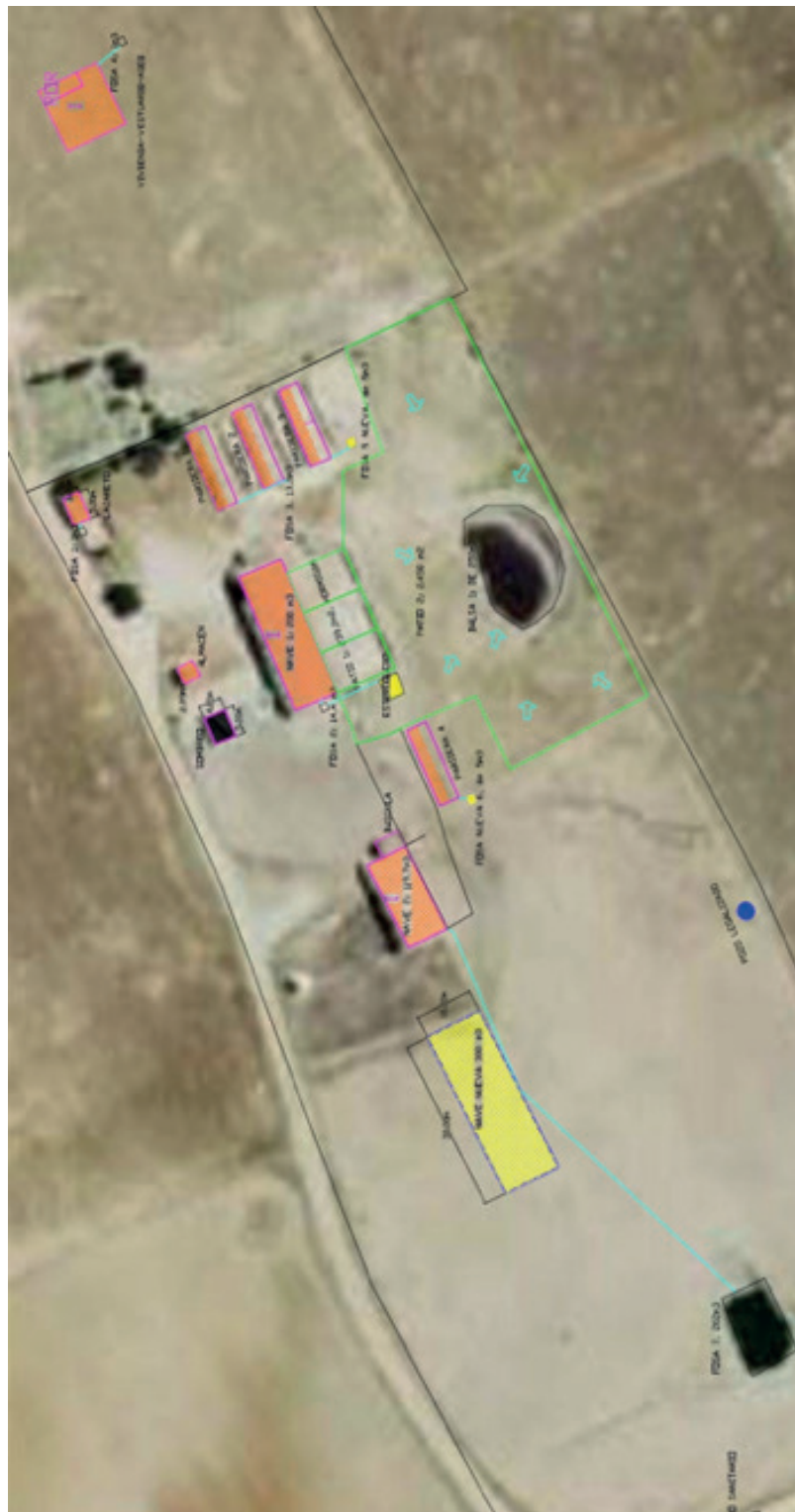
Imagen 1. Planta de las instalaciones