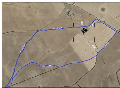
SITUACIÓN EN PARCELA

La explotación contará además con anexo de 32 m 2 (8 x 4 m): sala control, vestuarios, anexo a nave de 180 m 2 para almacén, anexo a nave de 80 m 2 para almacén, dispondrá de fosa de 90 m 3 de capacidad para el almacenamiento de lixiviados y aguas de limpieza de naves, estercolero de 110 m 3 de capacidad con conexión a fosa, corral n.º 1 hormigonado de 664,25 m 2 , corral n.º 2 hormigonado de 308 m 2 , nave agraria de 931,5 m 2 , lazareto de capacidad suficiente, manga de embarque, vado sanitario, silos, pediluvios, zona de almacenamiento de cadáveres y cerramiento perimetral.