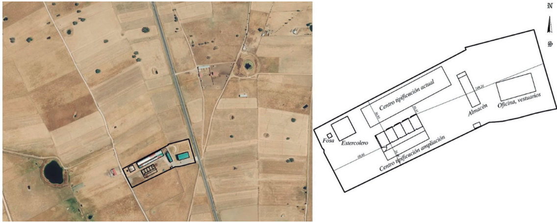
Imagen 1. Planta de las instalaciones