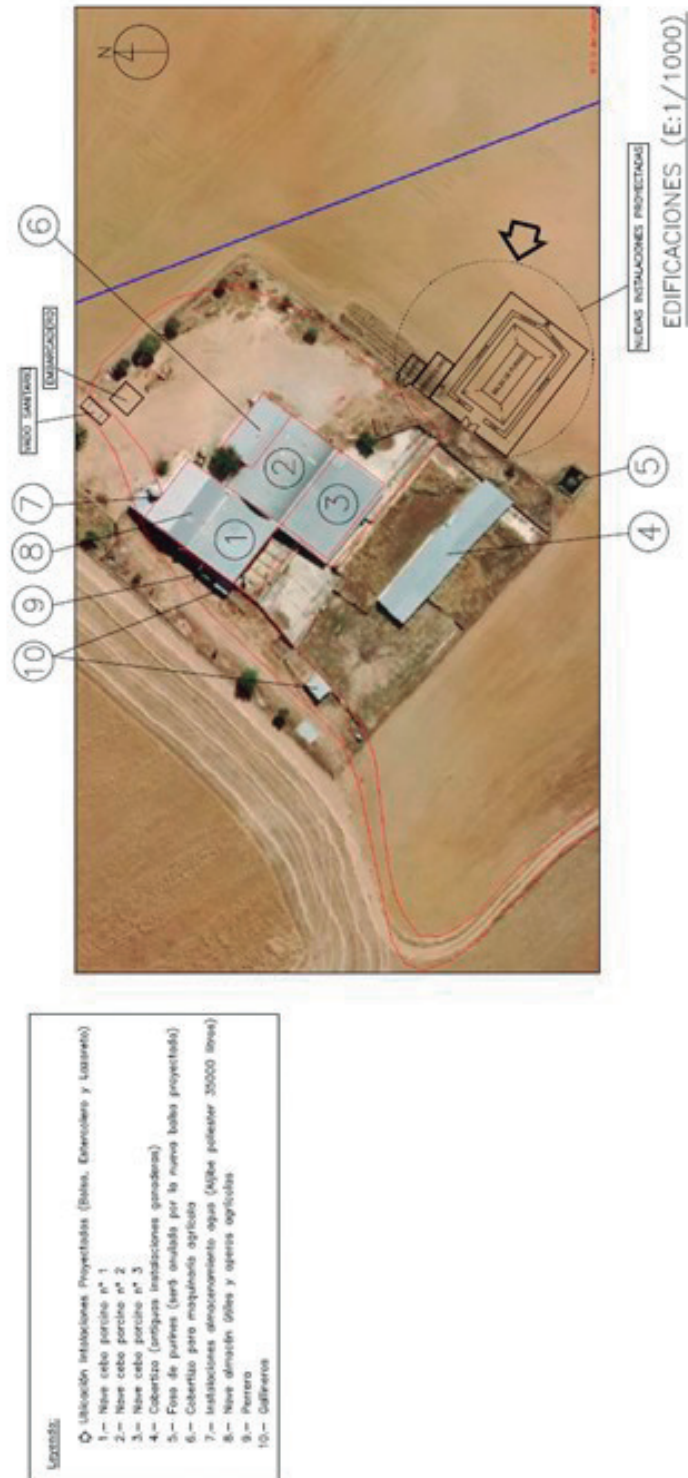
Imagen 1. Planta de las instalaciones