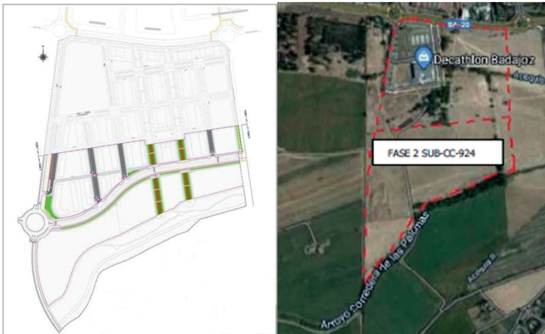
Fuente. Estudio de impacto ambiental. Planta General Fase 2.

El proyecto consiste en la urbanización de la Fase 2 del Sector SUB-CC-9.2.4 de Badajoz, situado junto a la Avenida de Elvas, y con una superficie de 220.761 m 2 , en la que se incluyen dos sistemas generales viarios (SG-V1 y SG-V2), así como la construcción de las instalaciones de abastecimiento, saneamiento, gas, electricidad y alumbrado público.