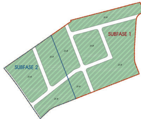
Plan Parcial Modificado

En la modificación del Plan Parcial se añade una nueva zona de ordenanza para uso Industrial, denominada Zona ZI-B, estableciendo las condiciones particulares de la misma.