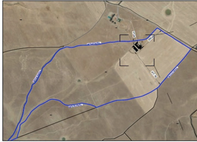
SITUACIÓN EN PARCELA ESCALA 1:10.000