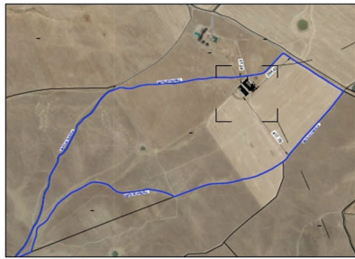
SITUACIÓN EN PARCELA ESCALA 1:10.000

fosa de 90 m 3 de capacidad para el almacenamiento de lixiviados y aguas de limpieza de naves, estercolero de 110 m 3 de capacidad con conexión a fosa, corral n.º 1 hormigonado de 664,25 m 2 , corral n.º 2 hormigonado de 308 m 2 , nave agraria de 931,5 m 2 , lazareto de capacidad suficiente, manga de embarque, vado sanitario, silos, pediluvios, zona de almacenamiento de cadáveres y cerramiento perimetral.